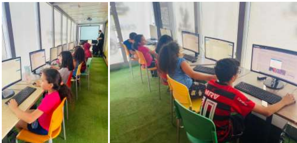
9ª MOSTRA DE TALENTOS

CURSOS: "FUNDAMENTOS DE PROGRAMAÇÃO COM GAMES" E "LÓGICA DE PROGRAMAÇÃO" - PARCERIA COM A FUNDETEC - FUNDAÇÃO PARA O DESENVOLVIMENTO CIENTÍFICO E TECNOLÓGICO.